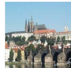
Karlův most a Pražský hrad

Finsko možná požádá Českou republiku o vyšetření úniku osobních informací týkajících se jeho nejvyšších představitelů, k němuž došlo po nedávném setkání vůdců Evropské unie a Spojených států v Praze. Ve veřejně přístupném počítači jednoho z pražských hotelů byly totiž po summitu objeveny osobní údaje finské prezidentky Tarji Halonenové, premiéra Mattiho Vanhanena a dalších přibližně 200 čelných státníků ze zúčastněných zemí.