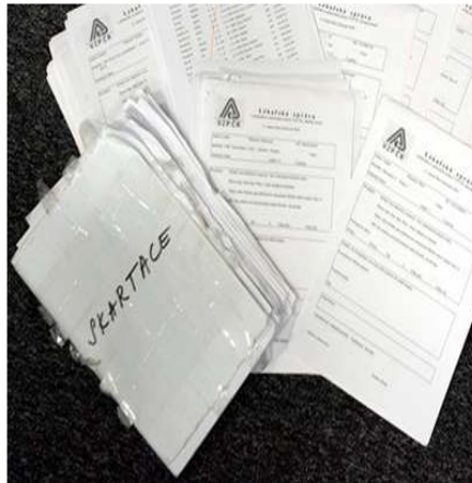
Dokumenty s citlivými daty údajně našel bezdomovec. Ilustrační foto.

Všeobecná zdravotní pojišťovna má problém. Někdo z jejich zaměstnanců vynesl ven balík s citlivými údaji o klientech. Dokumenty určené ke skartaci údajně našel bezdomovec a předal je MF DNES. Je to důkaz o nepořádku, který teď ve VZP vládne.